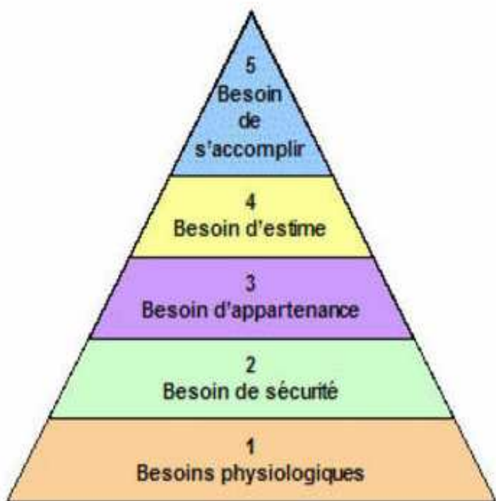
Pyramide de Maslow

J'ai ici un autre type de pyramide. C'est la pyramide structurale des niveaux sociaux et de l'espérance de vie humaine. Il existe d'autres visions, par exemple, les autochtones ont pour « pyramide » le cercle. Il n'y a pas de coin, c'est un cercle. Ils ont le cercle de guérison, le cercle de la vie. Essayons d'utiliser d'autres termes.